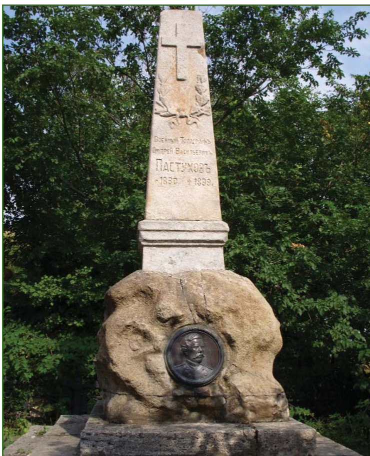
Памятник-obelisk А.В. Пастухову в Пятигорске на горе Машук.

аппаратом, стал первым в России фотографом, сделавшим снимки гор Кавказа и его высочайших вершин — Эльбруса, Казбека и Арарата.