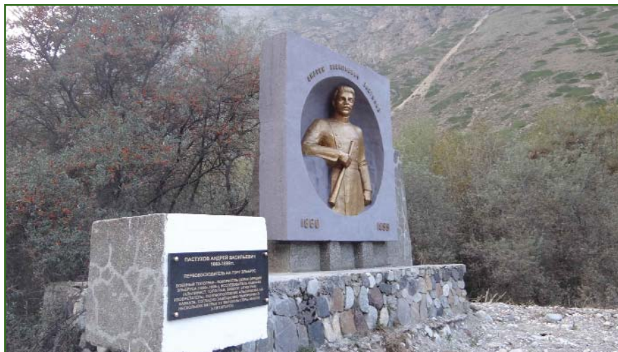
Монумент А.В. Пастухову в мемориальном комплексе первым покорителям Эльбруса.

— гора на Западном Кавказе, хребет Ужум, междуречье Большой Зеленчук — Маруха, Карачаево-Черкесская Республика — гора Пастухова (высота 2733 м).