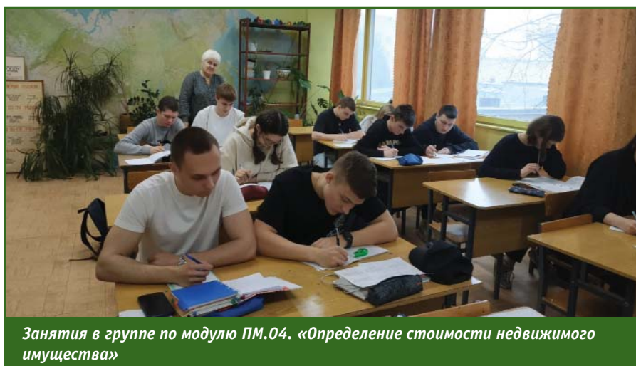
Занятия в группе по модулю ПМ.04. «Определение стоимости недвижимого имущества»

законодательство со стороны собственника или арендатора участка, определяет права на землю и другую недвижимость. Он должен знать земельный кодекс, правила оформления документации, уметь пользоваться геодезическими приборами, определять границы земельных участков, составлять межевые планы, оформлять документы, необходимые для закрепления собственности на землю и ее постановки на государственный учет.