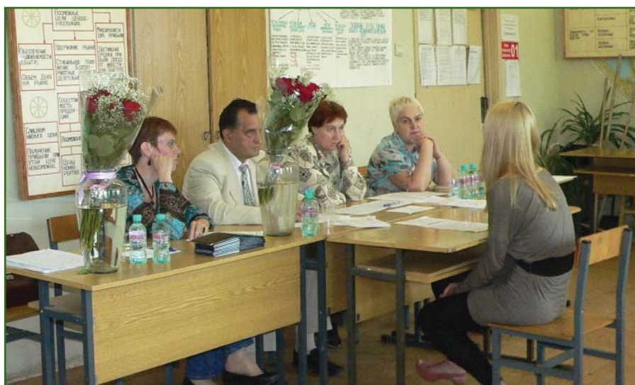
Комиссия по приему государственного экзамена

Права собственности на землю являются важной и надежной опорой для сельского хозяйства, поскольку для обеспечения устойчивой продовольственной безопасности необходима всеобъемлющая стратегия. Исследования показали, что гарантированные права собственности на землю стимулируют фермеров инвестировать в землю, занимать деньги для производства сельскохозяйственной продукции и улучшения качества земли, а также позволяют расширять