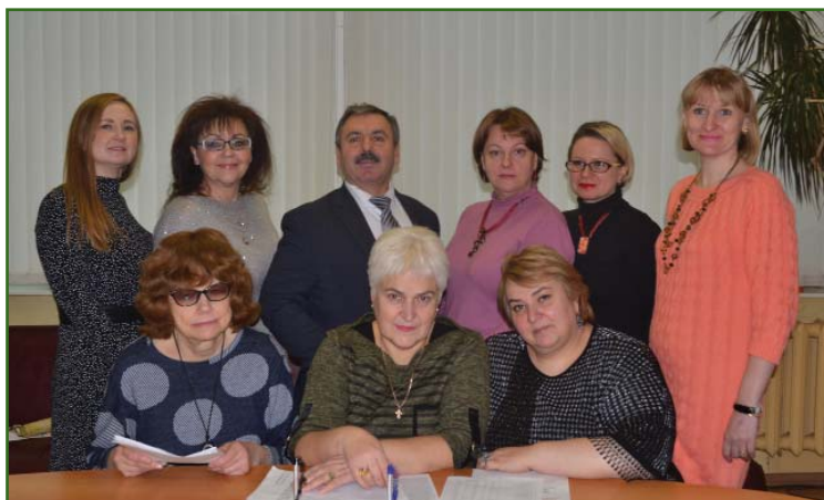
Предметно-цикловая комиссия «Гуманитарные и социально-экономические дисциплины»

Являясь руководителем предметно-цикловой комиссии «Гуманитарные и социально-экономические дисциплины» с 2005 г., задачей которой является организационное и методическое объединение преподавателей, могу отметить, что без дружной и сплоченной работы всех членов комиссии невозможно было бы достичь успехов в подготовке и воспитании будущих специалистов. Это и преподаватели пред-