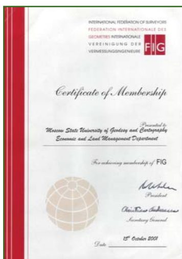
Сертификат о членстве в FIG

территориями и геодезического факультета МИИГАиК с Высшей технической школой в Гамбурге (Германия).