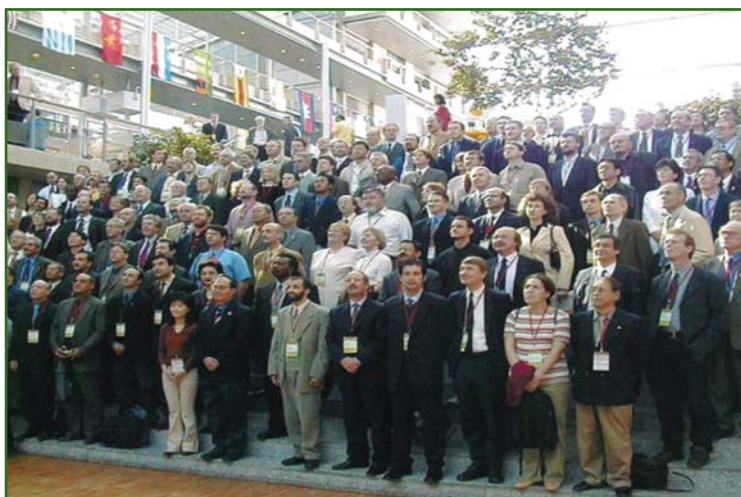
Представители факультета управления территориями на церемонии закрытия Генеральной ассамблеи FIG, 2003 г.

Был реализован совместный проект факультета управления