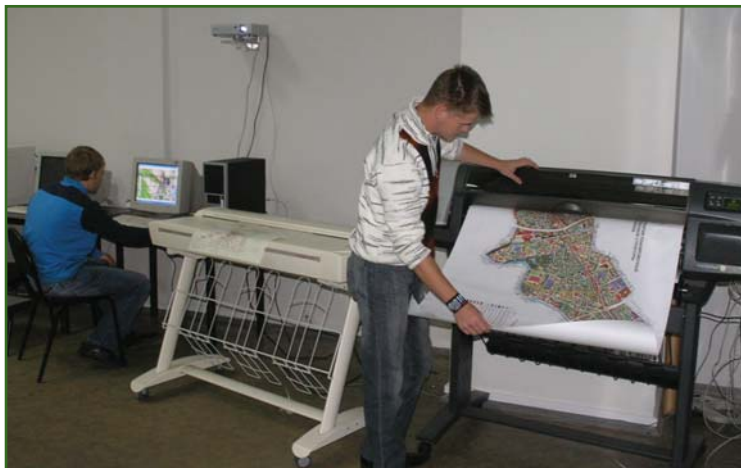
Лаборатория геоинформационных систем кадастра

Факультет с первых дней имел очень высокий конкурс абитуриентов. Далеко не все желающие могли поступить на него. Поэтому естественно, что успешно стало развиваться контрактное обучение — обучение, которое оплачивает сам студент. Контрактных студентов долгое время было гораздо больше, чем бюджетных. При этом успеваемость таких студентов была очень высокой. Факультет был финансово заинтересован в контрактных студентах, поскольку до 2012 г. примерно 50% дохода оставалось