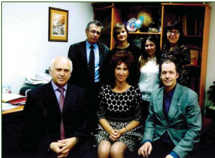
Руководство факультета управления территориями, 2016 г.

культета и возглавлял его до 31 марта 2021 г.