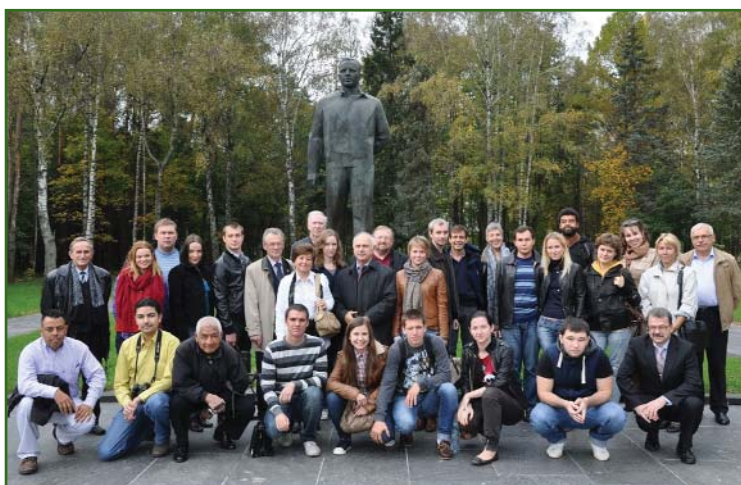
Участники Международной конференции «Образование в области геодезии, кадастра и землеустройства: тенденции глобализации и конвергенции» на экскурсии в Звездном городке, 2012 г.