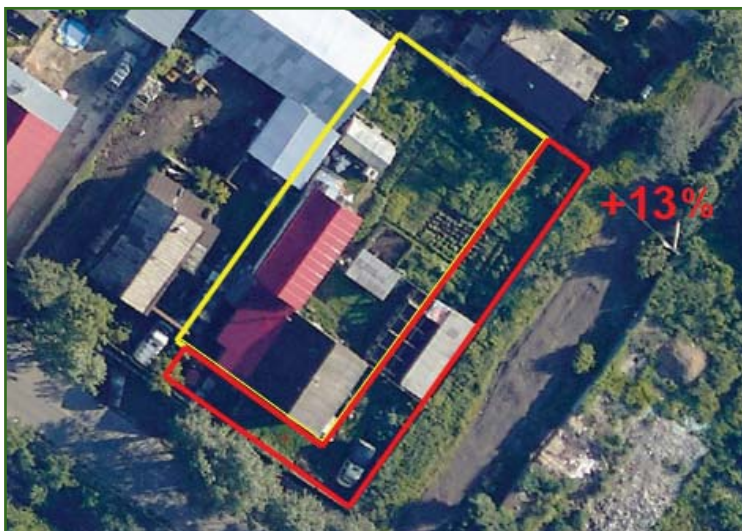
Рис. 5 Индивидуальная жилая застройка. Фактическая площадь земли превышает площадь, содержащуюся в сведениях ЕГРН, на 13%

всего 800 земельных участков, фактические площади которых превышали площади, содержащиеся в сведениях ЕГРН, более чем на 10%.