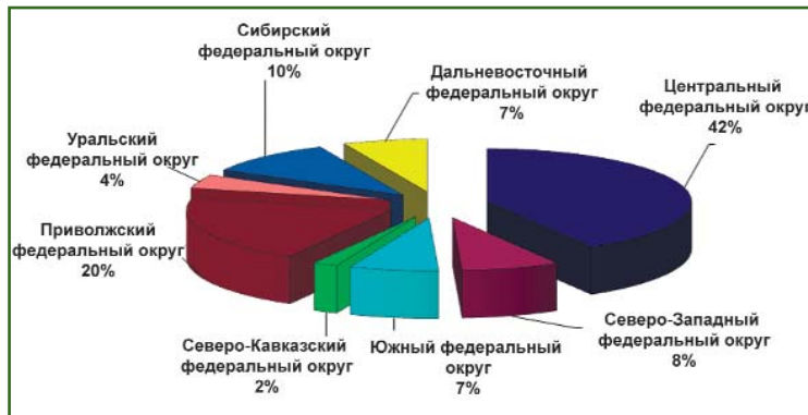
Рис. 1 Распределение членов НП «Кадастровые инженеры» по федеральным округам РФ

дах 1396 членов, полностью соответствующих требованиям законодательства и включенных в государственный реестр кадастровых инженеров (рис. 1).