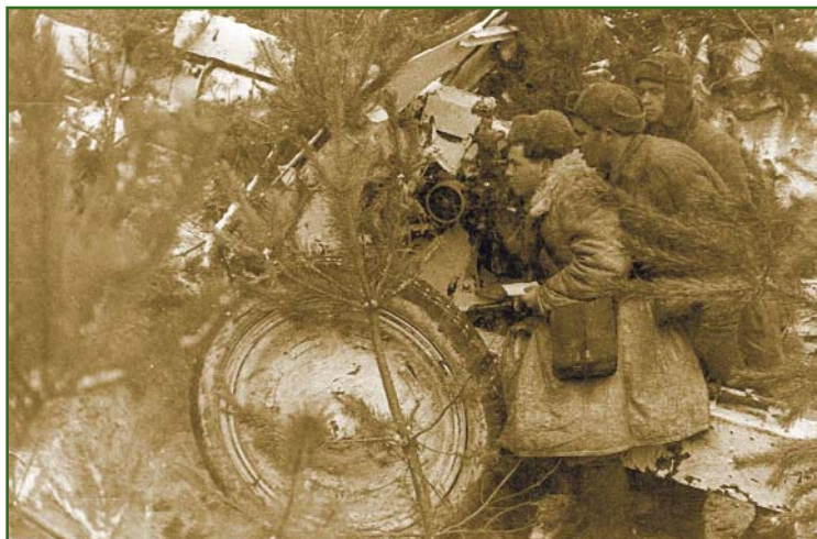
Рис. 4 Младший лейтенант П.Б. Петров осуществляет привязку орудия (1943 г.)

экстренно решать возникающие проблемы, включая получение сведений о минных полях, попавшихся на пути команды. Отправление в штаб связного не благоприятствовало успешному выполнению задания, поскольку в этом случае усиливалась нагрузка на каждого члена команды.