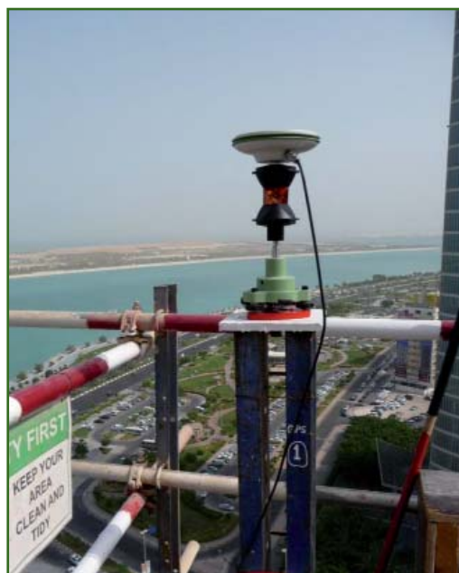
Рис. 2 Антенна спутникового приемника с круговой призмой

Компания Leica Geosystems (Швейцария) предложила технологию, включающую использование высокоточного спутникового и геодезического оборудования, измерения которым выполнялись на верхней части башни — монтажном горизонте, инклинометров (датчиков наклона), устанавливаемых стационарно на определенных этажах, и программно-аппаратного комплекса для