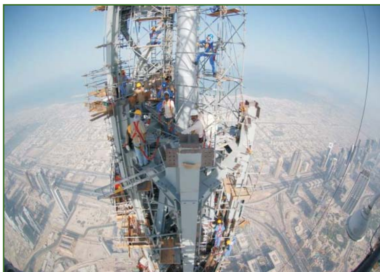
Рис. 6 Монтажные работы при установке стальной конструкции надстройки и шпиля

Со временем были подобраны оптимальные способы фильтрации данных, улучшена обработка потока данных и их представление, а также методы проверки качества и целостности данных. Разработанная технология сделала геодезическое обеспечение строительства башни простым и «прозрачным» процессом, позволила предоставлять исходные данные и осуществлять контроль монтажных и бетонных работ в условиях ограниченной видимости и при любых погодных