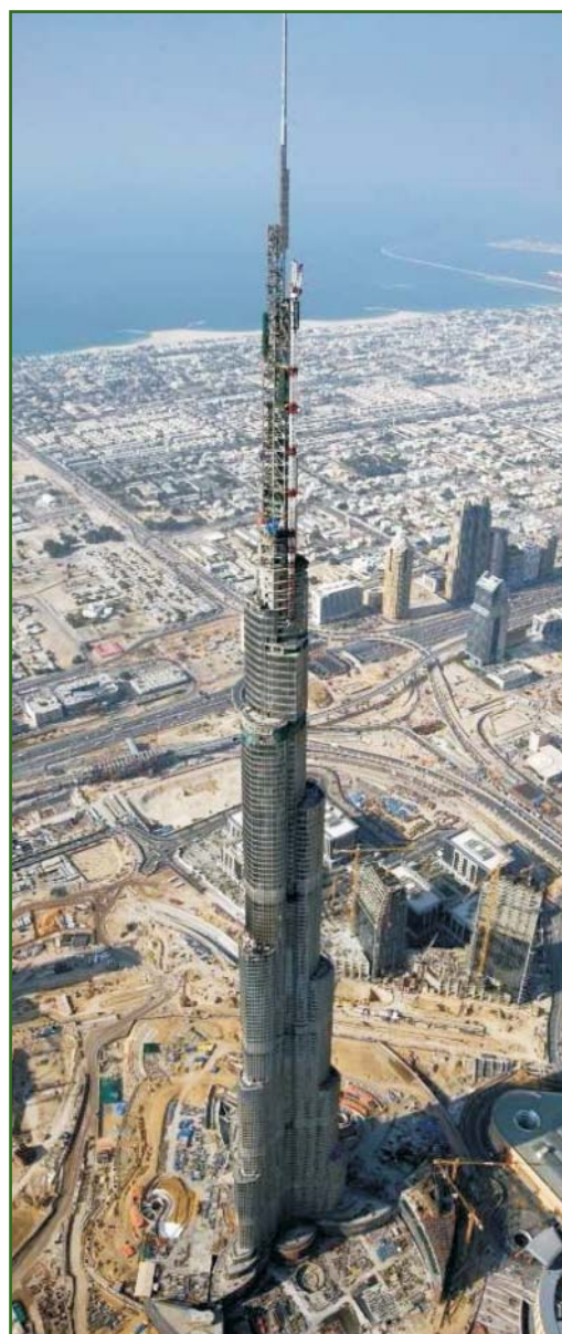
Рис. 1 Общий вид здания Burj Dubai.

зов позволяют перераспределять возникающую нагрузку или передавать ее на вуты (утолщения) несущих балок.