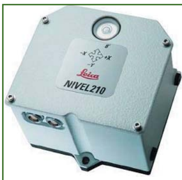
Рис. 5 Общий вид инклинометра

чек, были неразрывно связаны со щитами «скользящей» опалубки, постоянно перемещающимися гидравлическими домкратами. Поэтому опорная точка на горизонтальном или вертикальном опалубочном щите или на вертикальной стенке была нестабильна и перемещалась во время движения опалубки.