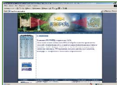
НПЦ «Геотрейд» www.geo-trade.ru