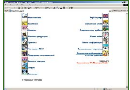
НПП «Навгеоком» www.agp.ru