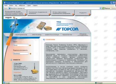
Торcon Positioning Systems www.topconps.ru