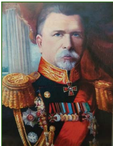
Начальник Санкт-Петербургского юнкерского военно-топографического училища генерал-майор Н.Д. Артамонов

Гродненской, Пермской и Воронежской губерний.