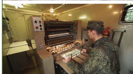
Подготовка специалистов на факультете топогеодезического обеспечения и картографии ВКА им. А.Ф. Можайского