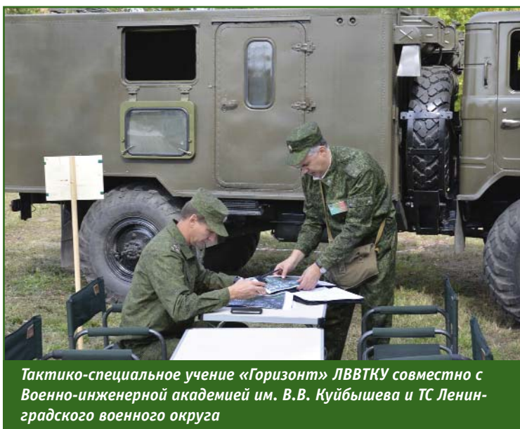
Тактико-специальное учение «Горизонт» ЛВВТКУ совместно с Военно-инженерной академией им. В.В. Куйбышева и ТС Ленинградского военного округа

В 1972 г. состоялся первый выпуск по программе высшего военного образования. Впервые ЛВВТКУ совместно с геодезическим факультетом Военно-инженерной академии имени В.В. Куйбышева и Топографической службой Ленинградского военного округа было проведено тактико-специальное учение «Горизонт». В 1980 г. ЛВВТКУ было присвоено имя генерала армии Антонова А.И.