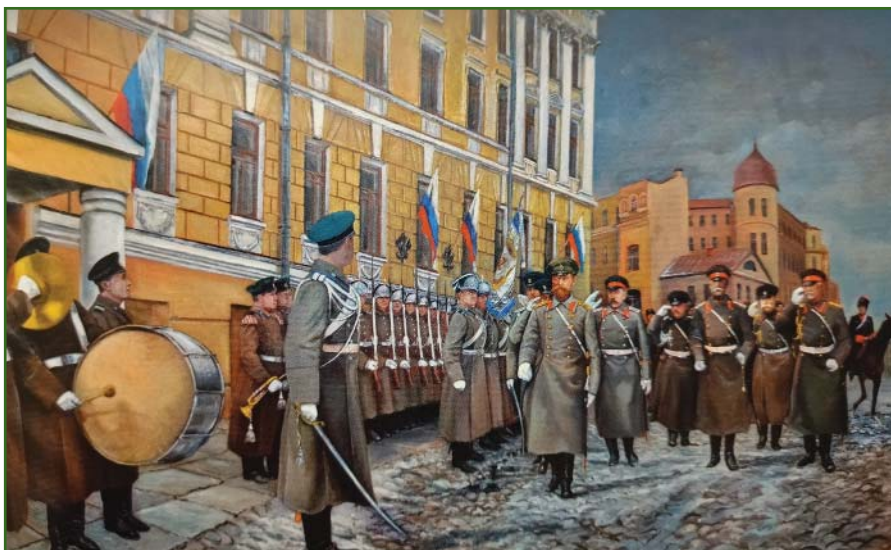
Посещение Санкт-Петербургского юнкерского военно-топографического училища Императором Николаем II

завершилась разработка проекта реконструкции здания, где располагалось училище. 5 мая 1910 г. был утвержден закон, одобренный Государственным Советом и Государственной Думой Российской Империи, о выделении 600 тыс. руб. на переустройство здания училища в течение 1910–1912 гг.