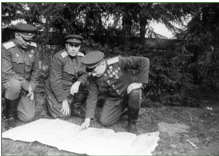
Планирование боевых действий во время Великой Отечественной войны 1941–1945 гг.