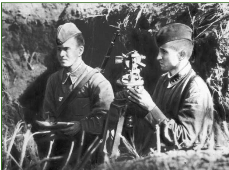
Засечка вражеских позиций во время Великой Отечественной войны 1941–1945 гг.

Подготовка высококвалифицированных военных кадров в училище осуществлялась на кафедрах: фототопографии, фотограмметрии, геодезии и картографии, высшей геодезии, радиогеодезии и радиоэлектроники, картографии, тактических дисциплин, высшей математики, физики, химии, марксизма-ленинизма, иностранных языков и др.