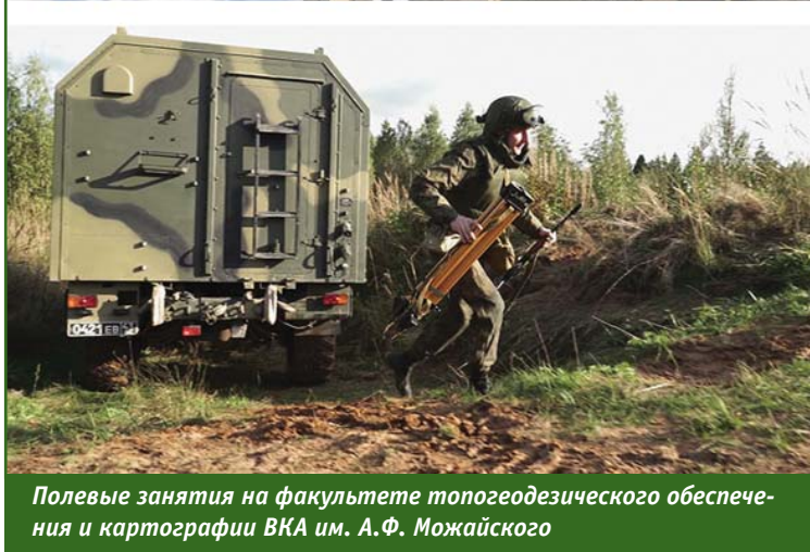
Полевые занятия на факультете топогеодезического обеспечения и картографии ВКА им. А.Ф. Можайского