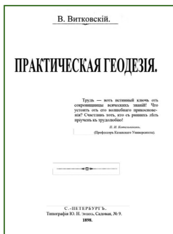
Титульный лист учебника В.В. Витковского «Практическая геодезия» ( https://www.gsi.ru )