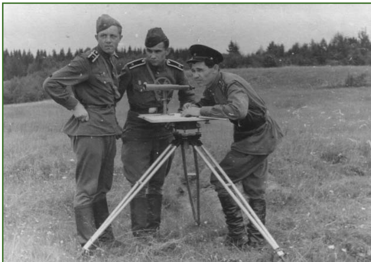
Курсанты ЛВВТКУ на полевых работах