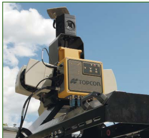
Рис. 2 Общий вид блока управления системы IP-S2 с датчиками измерений

Сбор данных. Перед началом съемки в каждом из пяти населенных пунктов система заново включалась и инициализировалась. После окончания измерений систему выключали, и автомобиль переезжал в другой населенный пункт. Безусловно, можно и не выключать систему при переезде с места на место, но в этом случае накапливается слишком большой объем данных, которые не используются при последующей обработке. Чтобы избежать этого, работы по сканированию выполнялись