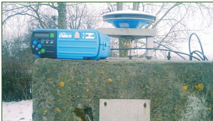
Рис. 2 Измерения на пункте полигона с помощью спутникового геодезического приемника Z-Xtreme

статьи, законодательно процедура метрологического обеспечения определена только для традиционных геодезических приборов: оптических и электронных нивелиров, теодолитов и тахеометров, лазерных дальномеров и рулеток, мерных рулеток и т. д. Утвержденные требования и методики метрологической аттестации спутниковых геодезических приемников ГЛОНАСС, GPS и GPS/ГЛОНАСС в настоящее время отсутствуют. В то же время спутниковое оборудование таких фирм, как THALES Navigation, Trimble Navigation, Leica Geosystems, Sokkia, Topcon и др., находит широкое применение во многих организациях, выполняющих топографические и землеустроительные работы в Нижегородской области. Кроме того, каждая фирма-производитель оборудования предлагает собственное программное обеспечение для постобработки спутниковых наблюдений, например, Trimble Geomatic Office, SKI, Ashtech Solution, Pinnacle и др. В этом случае на первый план выступает уже не столько метрологическая аттестация спутниковых приемников как средств измерений, сколько корректность получаемых результатов измерений после обработки соответствующим программным обеспечением. В отсутствии регламентирующих до-