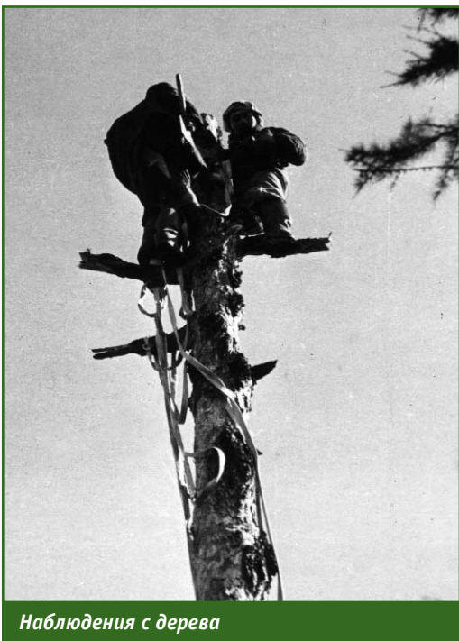
Наблюдения с дерева

Скажу честно, не раз в голову закрадывалась мысль: а не пора ли остановиться и поставить точку на полевых работах? Особенно, когда возвращаешься домой в декабре-январе месяце. Но наступает март, в окно начинает заглядывать ласковое солнышко, и уже не сидится. Душа где-то за Уралом. Новый полевой сезон, новые люди, новые встречи. И я не одинок. Нас много таких.