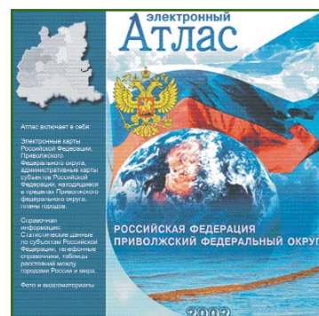
Рис. 2 Первое издание атласа в электронном виде

— хранения, оперативного доступа и обновления пространственной и атрибутивной информации о большом количестве объектов;