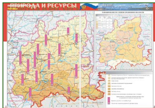
Рис. 3 Раздел «Природа и ресурсы» второго издания атласа

Кроме того, предполагается существенно расширить раздел «Регионы Приволжского федерального округа». В общегеографический раздел атласа предполагается добавить политическую карту «Россия и сопредельные государства», а также политико-административные карты всех федеральных округов. Тематическая часть атласа будет несколько сокращена за счет переработки некоторых те-