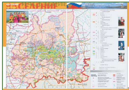
Рис. 4 Раздел «Население» второго издания атласа

Раздел «Регионы Приволжского федерального округа» претерпит наиболее существенные изменения. Кроме специально разработанных карт территорий субъектов Российской Федерации в масштабах 1:600 000–1:1 800 000, планов городов — столиц и административных центров в масштабах 1:30 000–1:80 000, а также справочной информации, предполагается в каждом регионе разместить 8 тематических карт и 3 карты-врезки. По каждому региону предполагается разра-