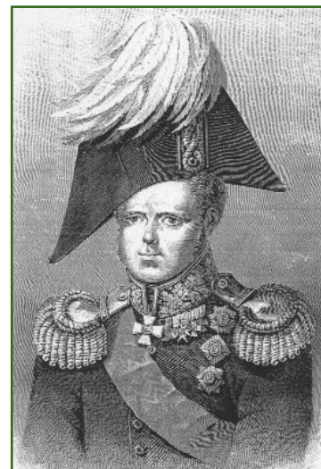
Рис. 2 Великий князь Константин Павлович (1779–1831)

Еще до коронации Павел I подписал важные указы по межевому делу и смежным отрас-